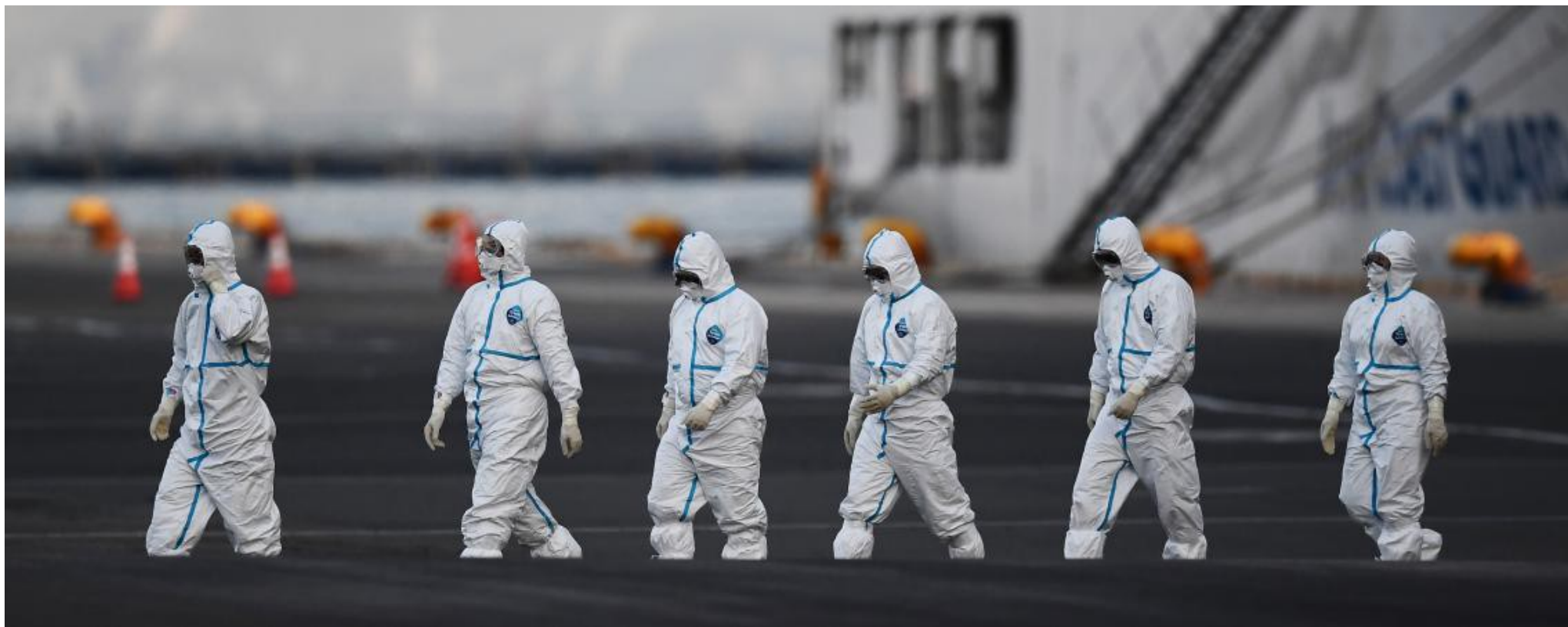
Notre équipe en pleine préparation de cette matinale spéciale coronavirus